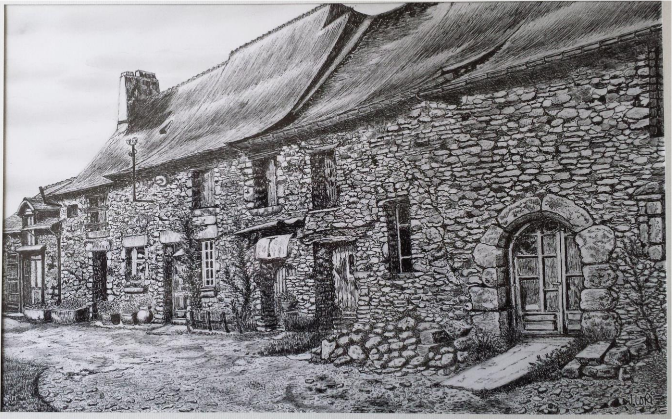
Ce tableau a été réalisé à l'encre, au stylo plume, en s'inspirant d'une photo

Voici le croquis de Jean LORI, intitulée « la maison bretonne »